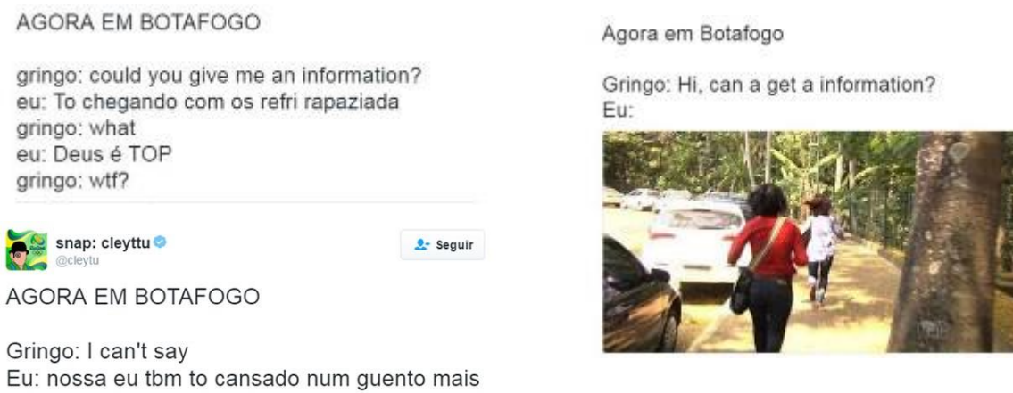
Figura 5 – Usuários atualizam os diálogos com personagem “gringo”. Fonte: https://goo.gl/JY4CAi . Acesso em: 20/02/2017.

se inseriam e formavam o meme, se mantendo estável em praticamente todas as publicações deste tema que foram coletadas. Ou seja, ao invés de designar o bairro onde o fato acontece, a expressão passa a representar a marca das adaptações que derivam de uma mesma postagem.