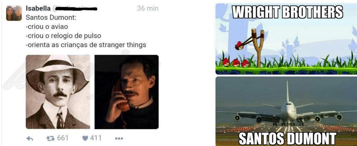
Figura 3 – Publicações satirizam o consenso norte-americano sobre a invenção do avião.

‘trem’ de pouso. Caso encerrado”. O que se percebeu, em geral, foi uma defesa engajada por parte dos usuários brasileiros da tese nacional de que Santos Dumont é o inventor do avião. A tutela deste argumento por vezes ocorreu através da ironia com o feito dos Wright, comparando-o a uma catapulta ou estilingue.