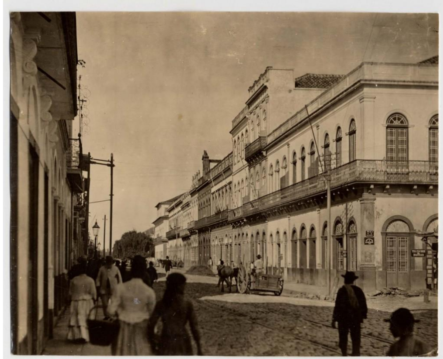
Figura 1: Esquina das Ruas 7 de setembro e Uruguai. A imagem data do início da década de 1890. Coleção Virgílio Calegari – Acervo do Museu Joaquim José Felizardo – Fototeca Sioma Breitman.

O Código de Posturas fixado em 1831, além de apontar os limites da cidade de Porto Alegre, reunia artigos relacionados a saneamento, como manter porcos em chiqueiros, criar cães daninhos, manter vasos nas janelas, correr a cavalo pelas ruas, o fechamento do comércio ao toque do sino, entre outros temas. Em relação à escravidão, conforme sublinha Macedo (1999, p. 62), estavam proibidos os castigos em lugares públicos, só sendo permitidos dentro da cadeia e não podendo exceder quarenta açoites. “Desde os primeiros números do primeiro jornal – o Diário de Porto Alegre – encontram-se notícias sobre as suas revoltas [ dos escravos ] e suas fugas, ao lado de anúncios para a venda deles, de diferentes idades e ambos os sexos”, destaca o autor (p. 74).