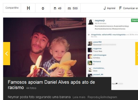
Figura 3: A campanha reverberou em jornais impressos, telejornais e sites.

No entanto, apesar de um grande número de pessoas compartilharem a ideia do movimento, muitos, porém, acusaram a agência Loducca de racismo e disseram que o protesto “Somos todos macacos” não servia como instrumento para a compreensão da identidade brasileira e muito menos para uma construção de uma cidadania mais plena.