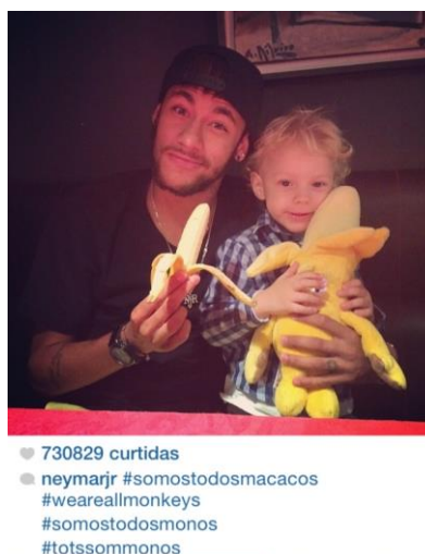
Figura 1: Neymar lança no Instagram a campanha Somos Todos Macacos.

Alves comer a banana atirada pelo torcedor do Villarreal, Neymar publicou uma foto no Instagram com o filho David Lucca no colo segurando uma banana (figura 1) e escreveu "Somos todos macacos", em português, inglês e espanhol.