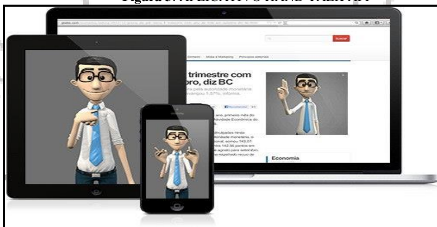
Figura 3: APLICATIVO HAND TALK APP

Reafirma-se que a função do aplicativo Hand Talk App não é a substituição do profissional intérprete e do tradutor da Língua Brasileira de Sinais, porém, cumpre a função de oferecer alternativas para que o processo comunicativo entre surdos e ouvintes seja fortalecido no contexto da escola inclusiva inserido na proposta de educação linguística. Ora, a educação linguística é, exatamente, a valorização do contexto e da maneira como os sujeitos se relacionam com a Língua na modalidade escrita e falada, tendo como referência a valorização das marcas identitárias que se inserem na formação de cada indivíduo, oferecendo-lhe oportunidades de contextualização das teorias linguísticas que circulam no espaço acadêmico e sua relatividade com as transformações sociais.