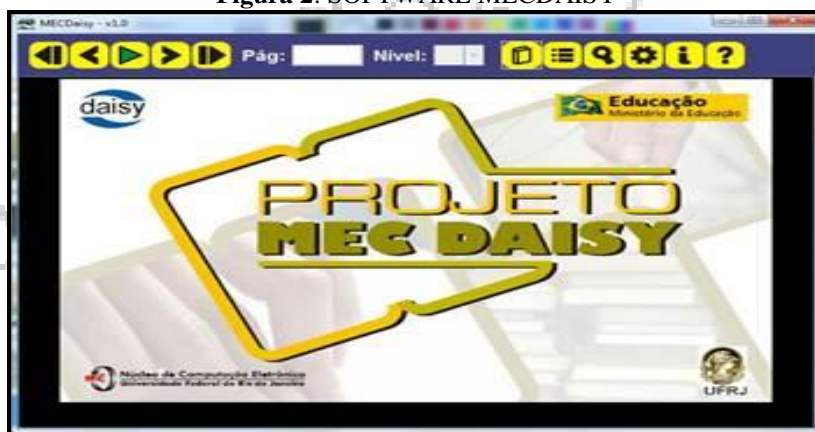
Figura 2: SOFTWARE MECDAISY

Os propósitos de todos os recursos tecnológicos apresentados, doravante, enquadram-se nas ações e na política da Educação Especial na perspectiva da Educação Inclusiva e de acessibilidade ao conhecimento, sendo, pois, propostas de tecnologia assistiva. Essa classificação tecnológica identifica todo o “arsenal de recursos e serviços que contribuem para proporcionar ou ampliar habilidades funcionais das pessoas com deficiência e, consequentemente, promover vida independente e inclusão” (SCHIRMER et al, 2007, p. 31).